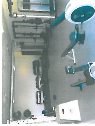
RGs fitness- og vægttræningsrum

For at kunne skabe optimale vilkår for hver enkelt, lægger vi fra skolens side op til et tæt samarbejde med de involverede klubber og specialforbund.